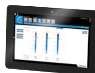
DIRIS D-90 (Bestellnummer: 4829 0210) Tablet-PC zur Türmontage mit Anschluss über Ethernet oder WLAN (über Router)

(1) Bis zu 4 Moduloptionen pro Buskoppler.